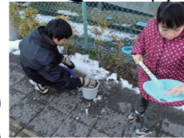
残った雪を集めて遊ぶ