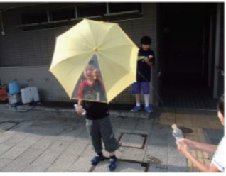
傘を使って水遊び

7月 16日(木) 23日(木) 30日(木) 8月 6日(木) 20日(木) 27日(木)