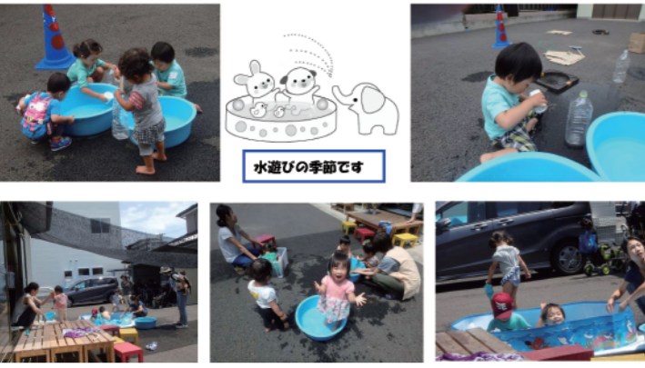
水遊びの季節です

NPO法人 冒険あそび場-せんだい・みやぎネットワーク 連絡先：070-6492-6232 (遊び場専用携帯) 「赤い羽根チャリティホワイトプロジェクト」助成事業