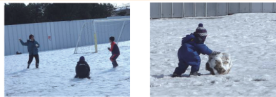
雷合戦 雷玉ころかし

3月の予定 (毎週日曜日) 1日・8日・15日・22日・29日 10時～16時 六郷小学校校庭の一角 ※1月～3月は「六郷おぼみさんのまったりサロン」をお休みします