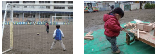
PK戦 のこぎりで切る

「冒険あそび場-せんだいみやぎネットワーク」とは… 私たちは、仙台市若林区を中心に遊び場づくりに取り組んでいます。また、情報収集・発信などを通してネットワークづくりをしながら、子どもの声がはるかに響く地域づくりに取り組んでいます。